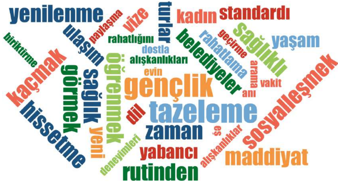
Ek 2. Katılımcıların Seyahat Deneyimlerine İlişkin Kelime Haritası